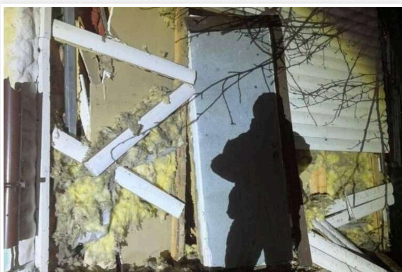
У КОВА розповіли про наслідки російської атаки на Київщину: пошкоджено будинки та 12 вантажівок

У ніч з 24 на 25 грудня Росія знову здійснила атаку на Київщину за допомогою дронів-камікадзе. В області успішно спрацювали сили ППО, проте через падіння уламків БПЛА пошкоджено будинки та 12 вантажівок.