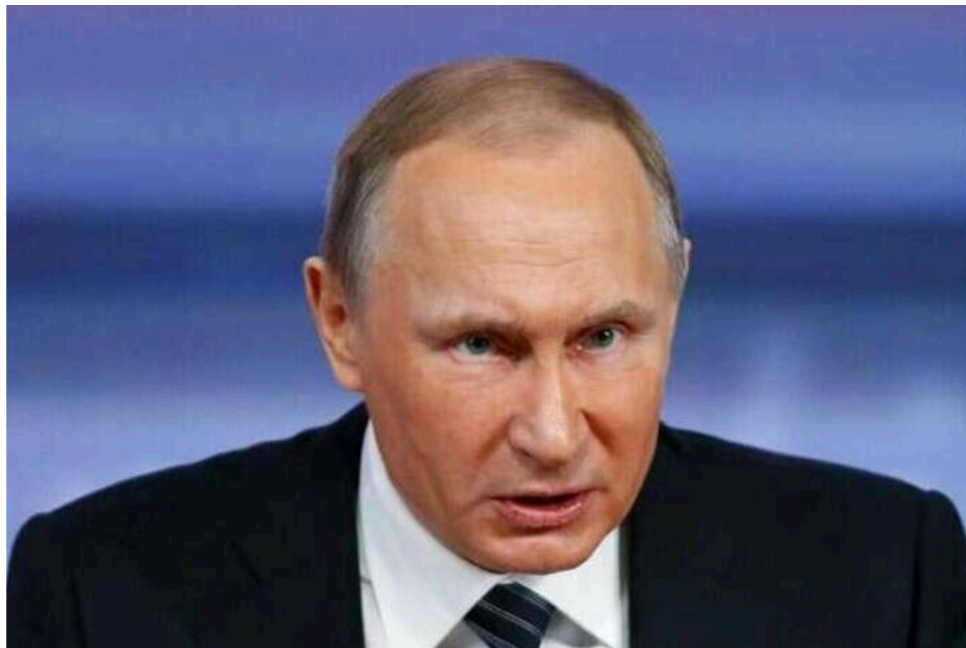
В ISW розповіли, що стоїть за заявами РФ щодо умов переговорів з Україною: чи досі Путін впевнений у шансах на успіх

Спікерка Ради Федерації РФ Валентина Матвієнко повторила тези російського диктатора Володимира Путіна про "відкритість Росії до компромісів у переговорах". При цьому Москва наполягає на висунутих раніше ультиматумах, які були оголошені ще навесні 2022 року в Стамбулі.