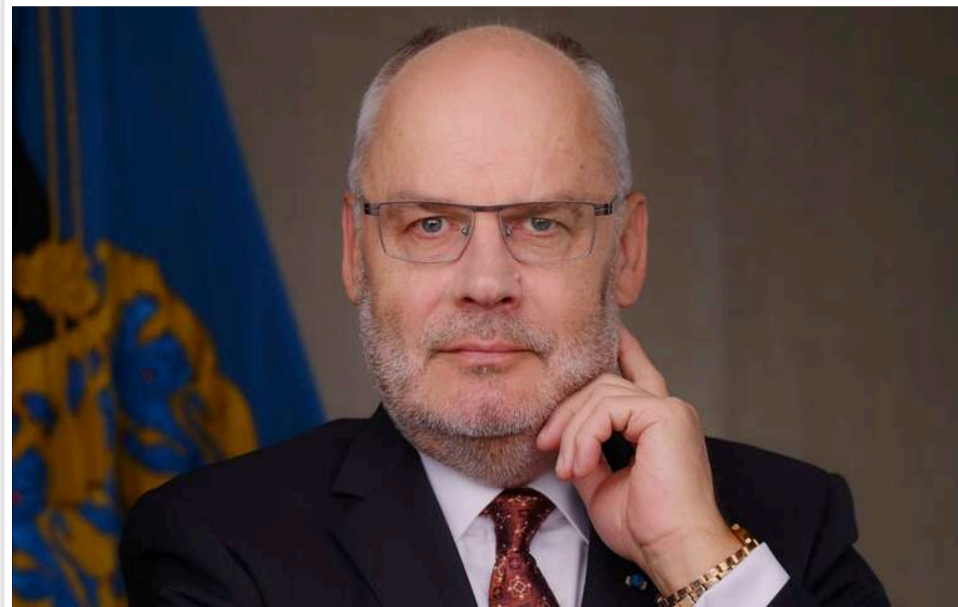
Президент Естонії впевнений, що його країна зможе уникнути війни

Президент Естонії Алар Каріс вважає, що його країна зможе уникнути війни.