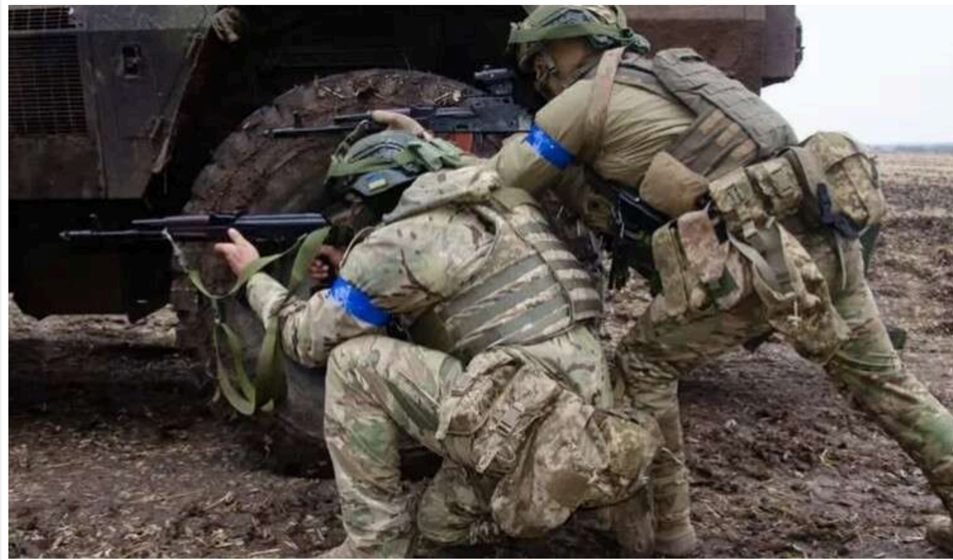
Українські десантники захопили в полон 11 окупантів

Українські військові зуміли захопити в полон 11 окупантів без жодного пострілу. Цю операцію здійснили бійці 77 окремої аеромобільної Нaddніпрянської бригади з суміжними підрозділами.