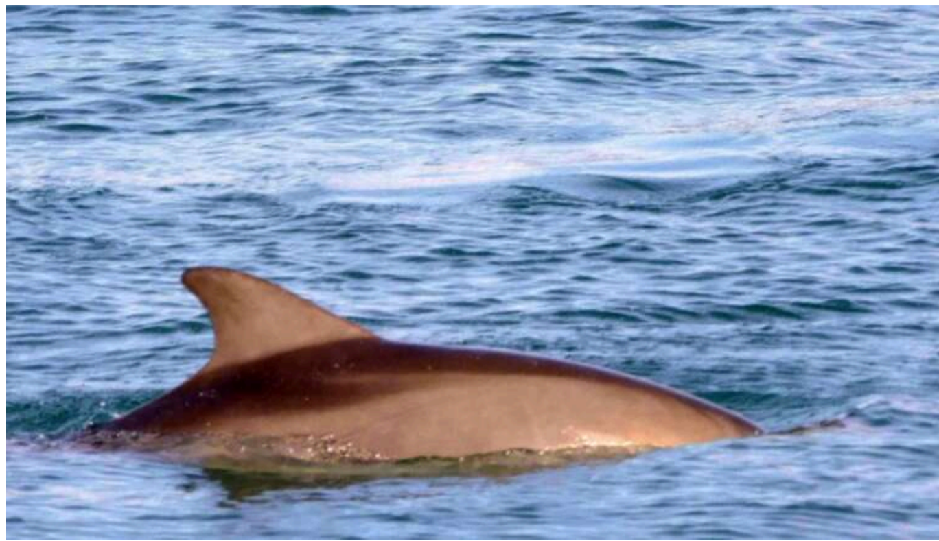
Наслідки аварії російських танкерів ще до кінця не відомі, - Плетенчук

Унаслідок затоплення російських танкерів у Чорному морі в місцях зимівлі дельфінів ссавці почали викидатися на чорноморське узбережжя.