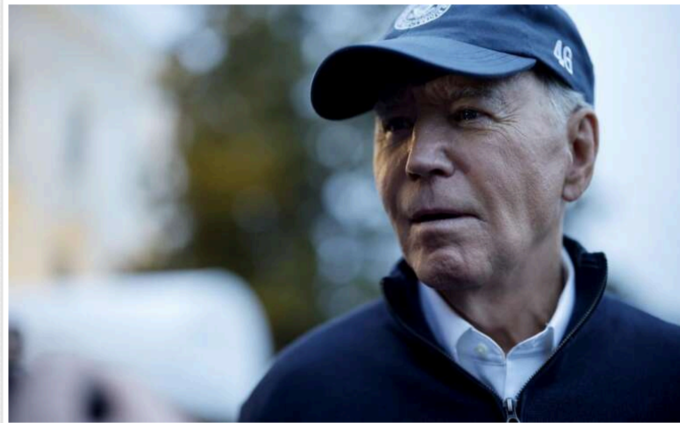
Стан здоров'я Байдена позначається на його роботі ще з передвиборчої кампанії 2020 року

З моменту своєї передвиборчої кампанії 2020 року Джо Байден стикається з труднощами у виконанні президентських обов'язків, викликаними віком і проблемами зі здоров'ям, повідомляє The Wall Street Journal, посилаючись на власні джерела.