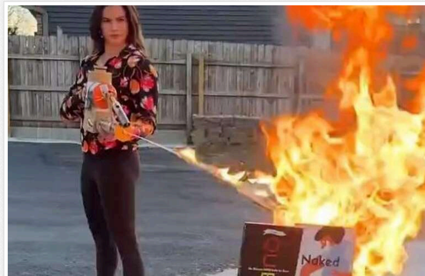
Екскандидатка на пост держсекретаря США запропонувала публічні страти для мігрантів, які скоїли злочини

Валентина Гомес, екскандидатка на посаду державного секретаря США, закликала до публічних страт мігрантів, які вчинили тяжкі злочини.