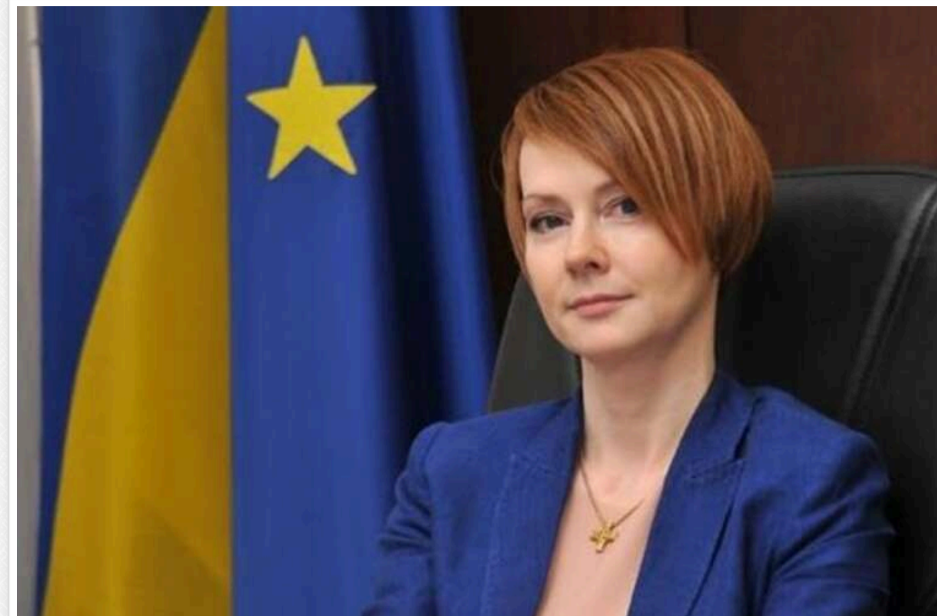
ЗМІ: Попри проблеми з НАЗК і сумнівні мільйони готівкою, Лану Зеркаль готують до участі у виборах

Політика повертається в життя України попри незавершену війну. І в середовищі політичного класу вже спостерігається метушня та конкуренція. Крім того, з'являються нові соціологічні дослідження, які наперед вказують на прізвища осіб, ласих до влади.