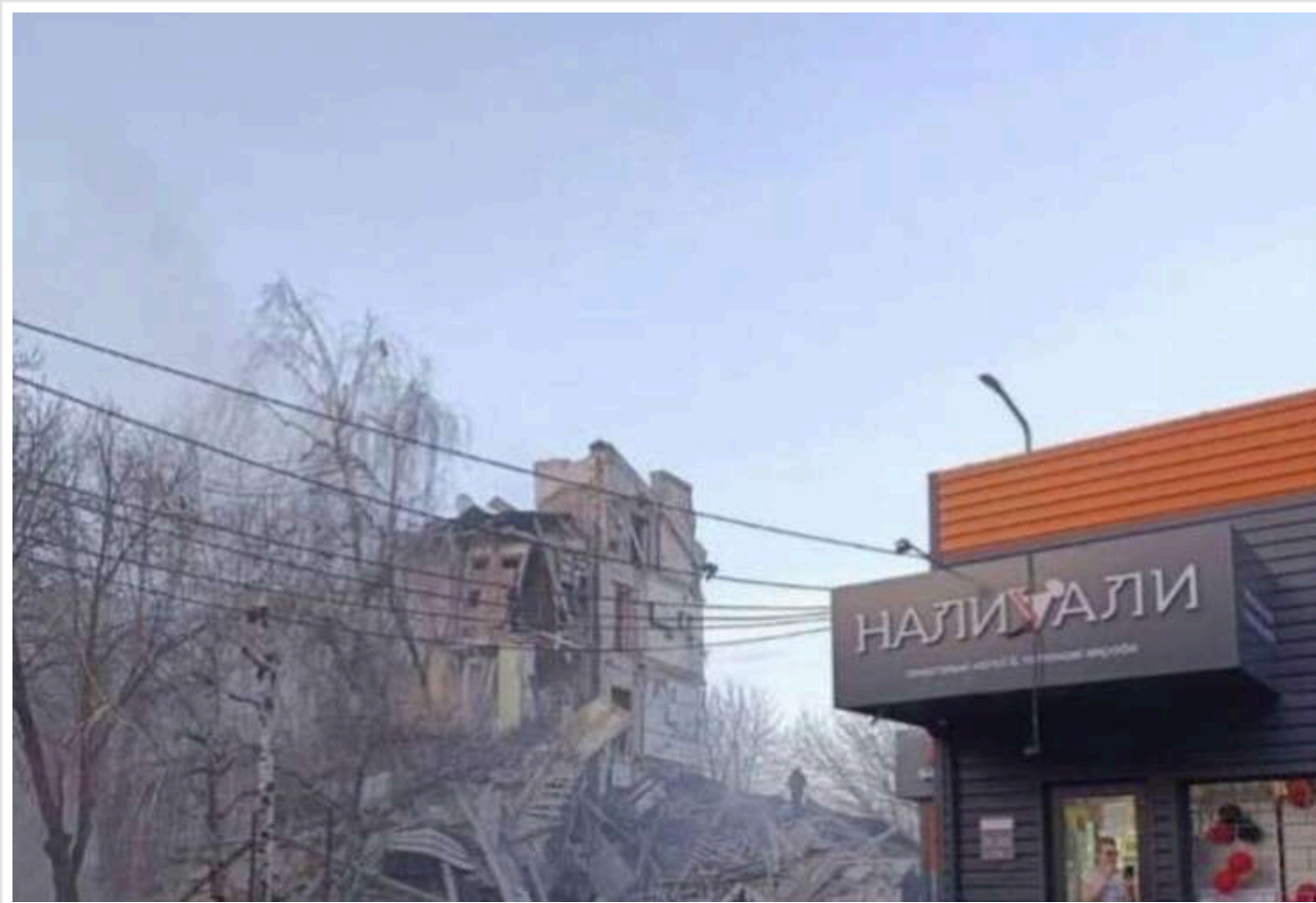
У Кривому Розі є приліт у житловий будинок, – Дніпропетровська ОВА

Російські терористи у вівторок, 24 грудня, здійснили атаку на Кривий Ріг. Ворожа ракета влучила в житловий будинок.