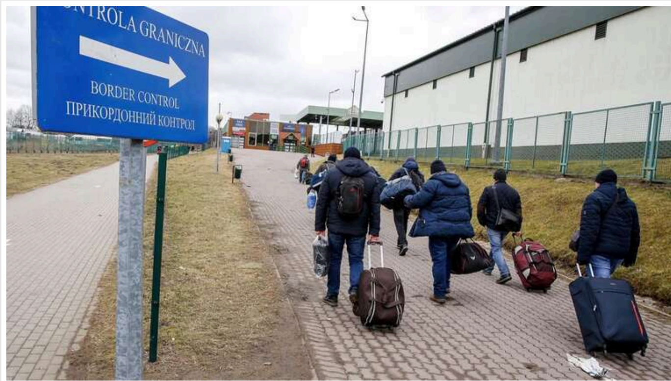
Повернути українських чоловіків із-за кордону під час війни хочуть за допомогою "гарантованого бронювання" при працевлаштуванні

Українських чоловіків, які перебувають за кордоном, планують повертати назад до країни ще до завершення війни. Уряд розглядає механізм, який передбачає працевлаштування із гарантією бронювання від мобілізації.