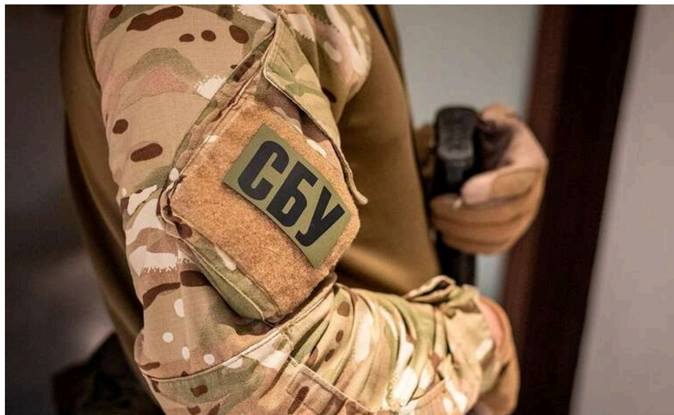
В СБУ вирішили витратити 17 мільйонів на обладнання і софт для перевірки декларацій своїх працівників

Служба безпеки України 19 грудня за результатами тендеру уклала угоду з ПрАТ «Інститут інформаційних технологій» про постачання програмно-апаратного комплексу для перевірки декларацій своїх працівників за 16,86 млн грн.