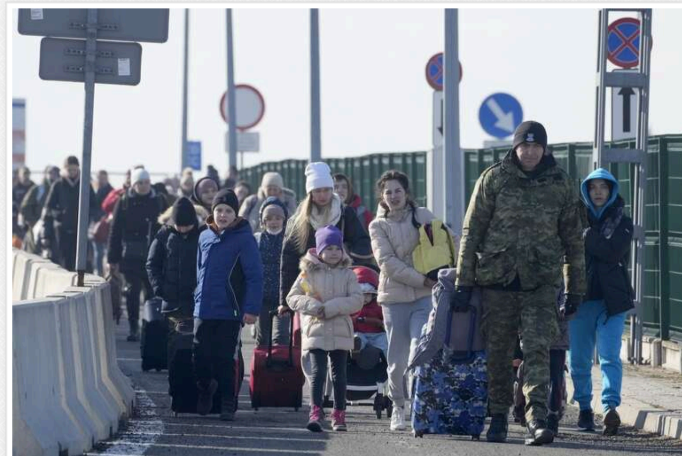
Українці масово повертаються до країни: на кордоні з Польщею - ажіотаж

Кількість українців, які прибули до країни, значно перевищила кількість тих, хто її покинув. Так, 23 грудня до України в'їхало 69 тис. осіб, а залишило країну 58 тисяч. При цьому найбільше навантаження спостерігається на пунктах пропуску на кордоні з Польщею.