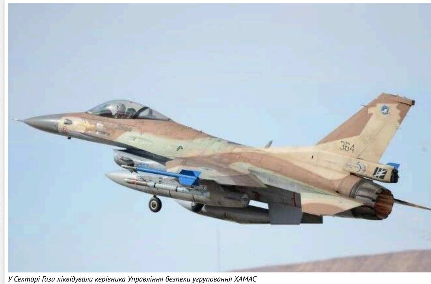
У Секторі Гази ліквідували керівника Управління безпеки угруповання ХАМАС