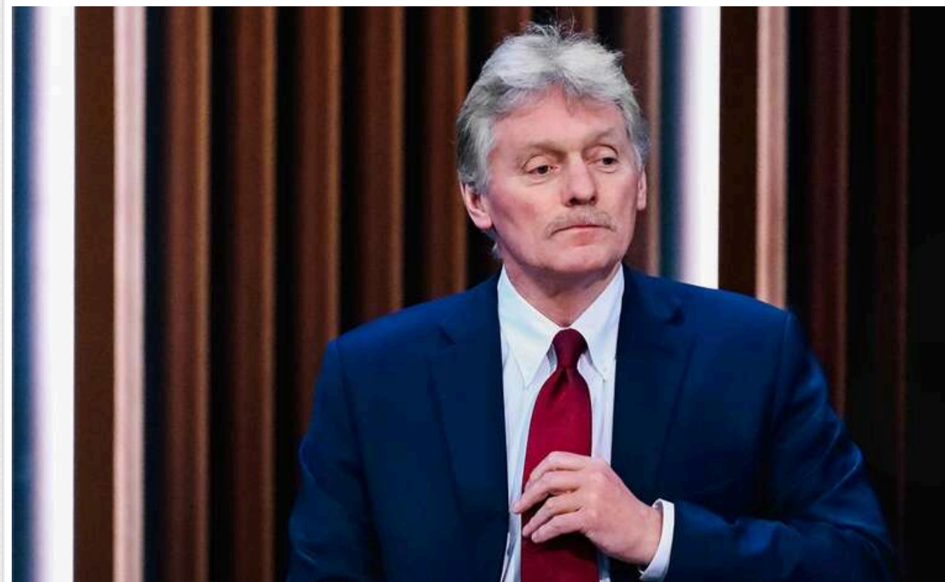
Пєсков зробив нову заяву про війну з Україною і можливість переговорів

У Росії заявили, що продовжуватимуть "спеціальну військову операцію" проти України доти, доки не виконають "всі завдання щодо забезпечення безпеки" РФ. У Кремлі також знову збрехали про свою "відкритість до переговорів", звинувативши Україну в небажанні їх розпочинати.