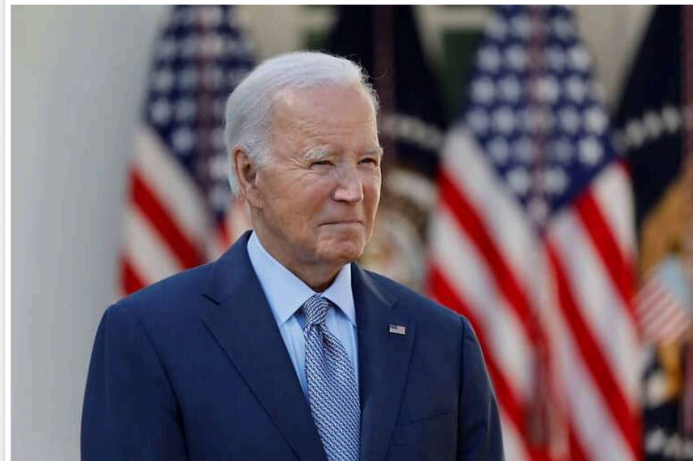
Джо Байден замінив усі смертні вироки федерального рівня в США на довічні ув'язнення

Президент США Джо Байден заявив у понеділок, 23 грудня, що він пом'якшує вироки для 37 із 40 осіб, які засуджені до смертної кари на федеральному рівні. Їхнє покарання він замінив на довічне ув'язнення.