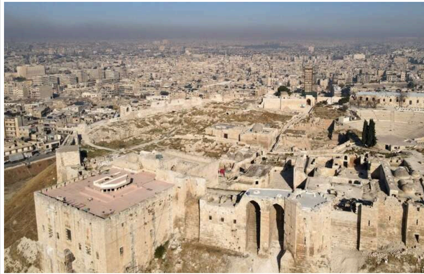
В ISW розповіли, коли Росія планує повністю вивести війська зі Сирії

Російські війська повністю покинули більшість місць розташування в Сирії, але все ще залишаються на авіабазі Хмеймім та в порту Тартус. Москва планує повністю вивести свої війська до лютого 2025 року.