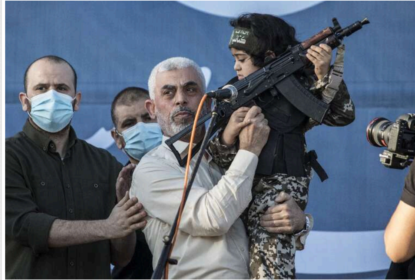
Ізраель Кац вперше підтвердив участь Ізраїлю в ліквідації лідера ХАМАС Ганії в Тегерані

Міністр оборони Ізраїлю Ізраель Кац вперше підтвердив, що Ізраїль був причетний до вбивства лідера політичного крила палестинської терористичної організації ХАМАС Ісмаїла Еанії. Він загинув влітку 2024 року від вибуху бомби, яку таємно заклали у його готельному номері в Тегерані.