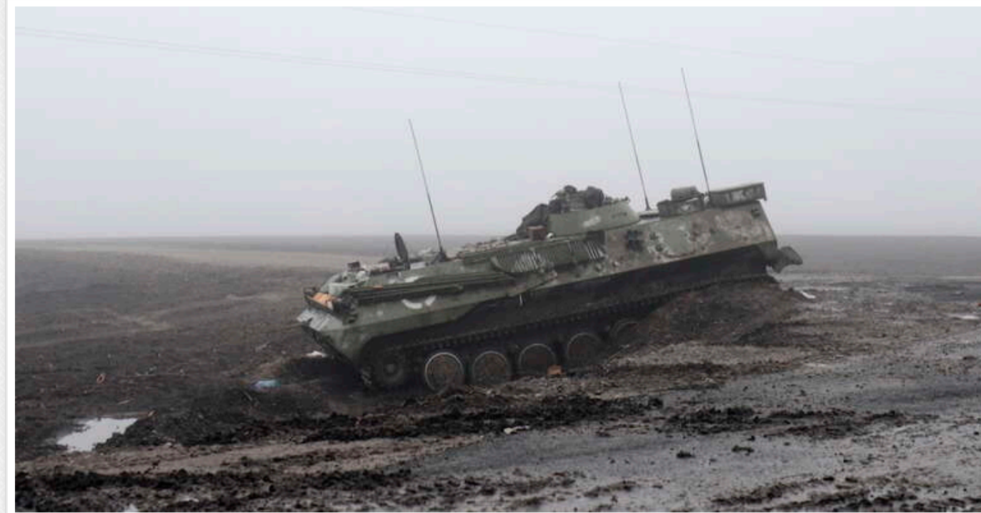
Загарбники втрачають взводи під час штурмів правобережної частини Херсонської області, - "АТЕШ"

Російські загарбники зазнають значних втрат під час атак на правий берег Херсонської області. Проте спроби прорватися на правобережжя продовжуються.