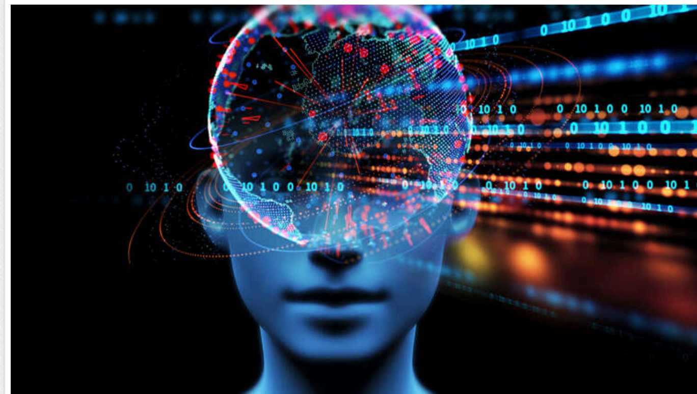
Ілон Маск передбачив, що штучний інтелект може перевершити людину вже до 2025 року

Ілон Маск заявив, що штучний інтелект може стати розумнішим за людину вже до кінця 2025 року. За його словами, ймовірність того, що ШІ перевершить інтелект усього людства до 2030 року, становить 100%.