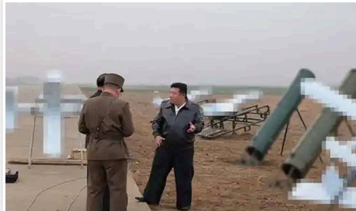
Корейська розвідка: КНДР може надати Росії додаткові війська й дрони-камікадзе

Північна Корея, ймовірно, готується відправити до Росії додаткових військових і військову техніку. До складу цього військового пакета для Москви можуть також увійти дрони-камікадзе.