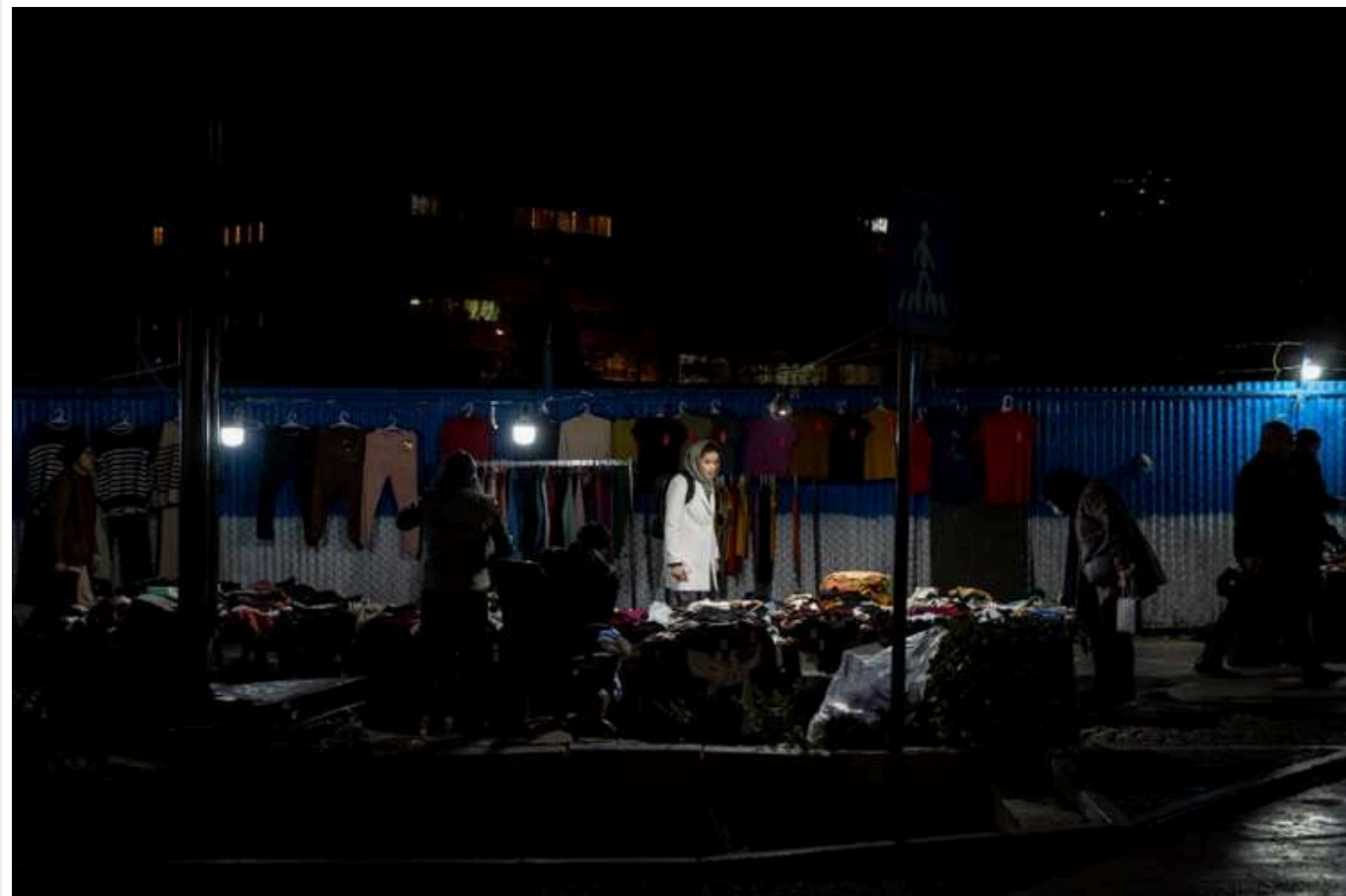
NYT: Енергетична криза в Ірані досягла критичної точки

Іран, володіючи одними з найбільших у світі запасами природного газу та нафти, зіштовхнувся зі складною енергетичною кризою. Автомагістралі та торговельні центри занурилися в темряву, а промислові підприємства були знеструмлені, що призвело до майже повної зупинки виробничих процесів.