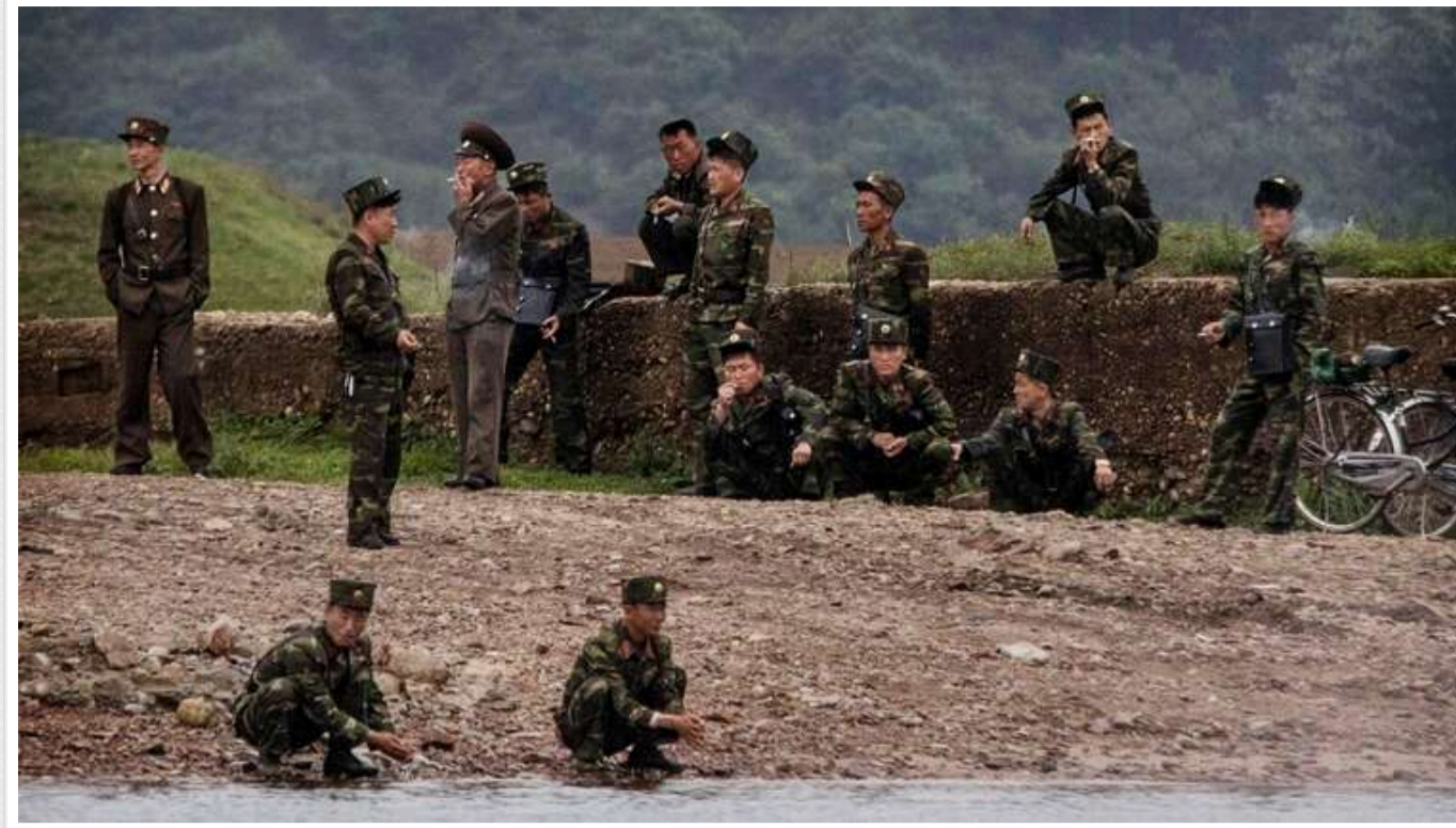
У ЗСУ пояснили, навіщо Росія видає підроблені документи військовим із КНДР

Влада країни-агресора видає документи військовим Північної Кореї, але вони є підробленими.