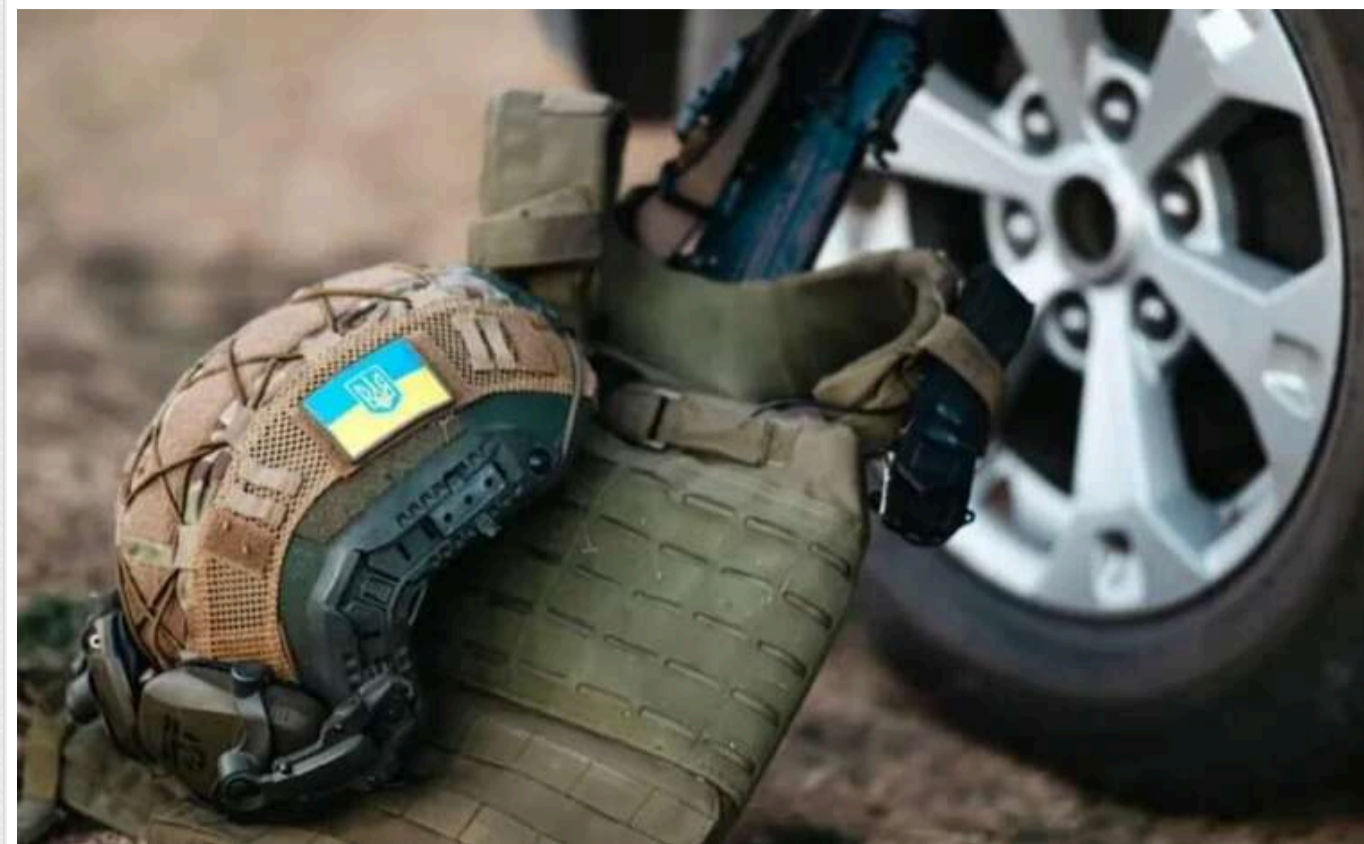
У Міноборони відповіли, через скільки військові, що повернулися із СЗЧ, повинні очікувати виплат

Військовослужбовці Сил оборони, які добровільно повернулися на службу після СЗЧ (самовільного залишення частини), знову отримуватимуть грошові виплати та забезпечення. Для цього потрібен офіційний наказ командира про зарахування до резервного батальйону.