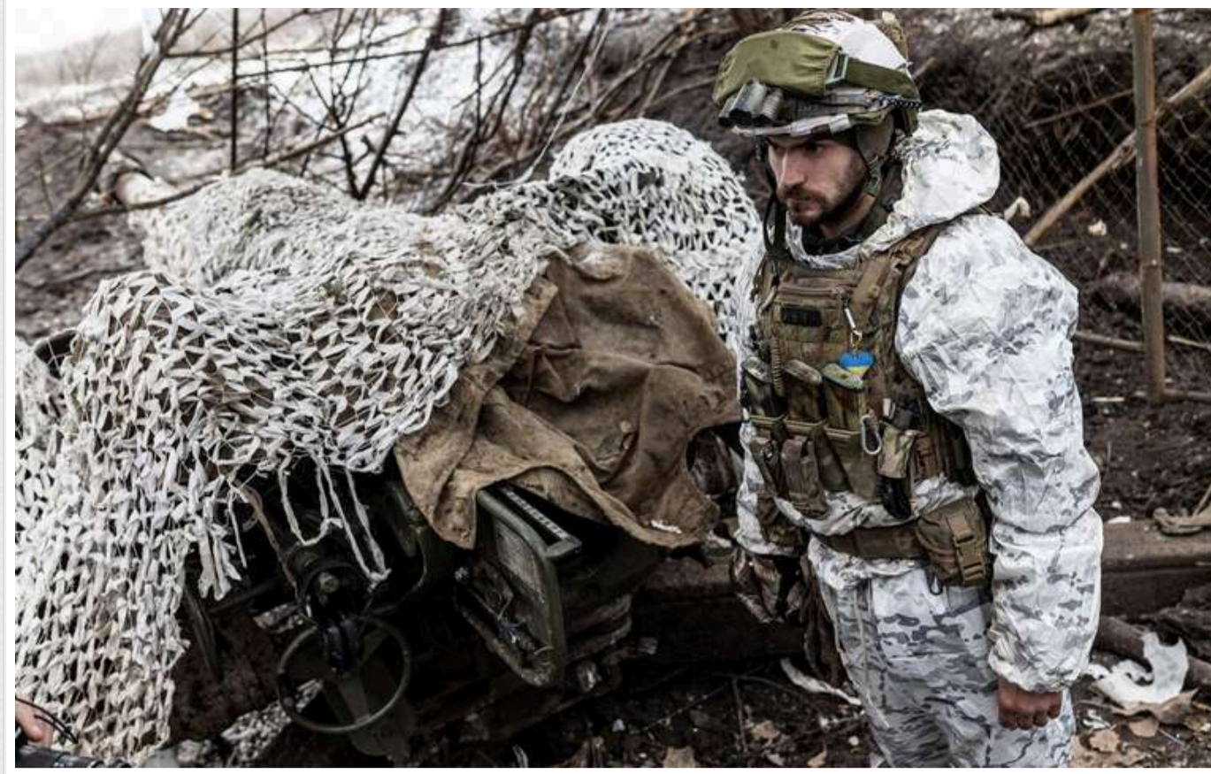
Ситуація на фронті: Найгарячіша ситуація на Времівському напрямку

З початку доби неділі, 22 грудня, кількість бойових зіткнень на фронті зросла до 117. Найбільш напружена ситуація залишається на Времівському напрямку, де сталося 23 бої.