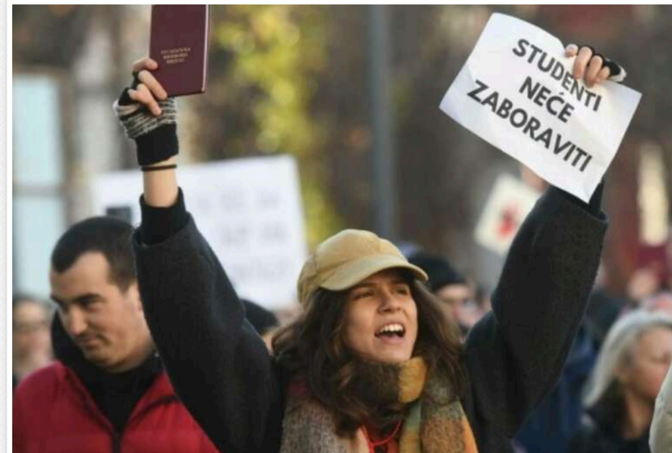
У Белграді десятки тисяч студентів знову вийшли на протест через трагедію в Новому Саді

Студенти, які вже майже місяць блокують університети, 22 грудня зібралися на мирну акцію протесту на центральній площі в сербській столиці Белграді.