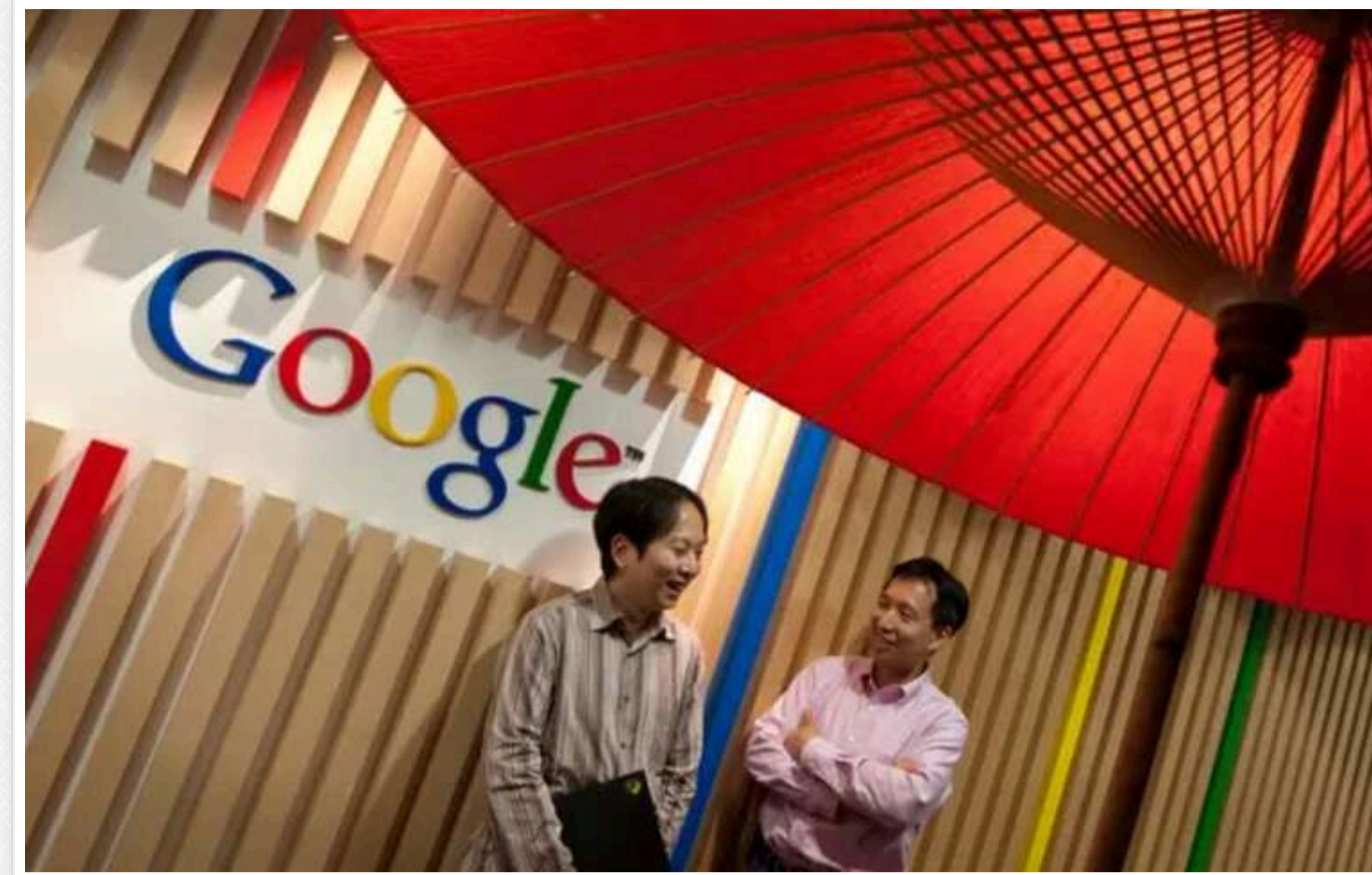
У Японії антимонопольне відомство визнало Google порушником закону

Передбачається, що антимонопольне відомство Японії визнає компанію Google винною у порушенні антимонопольного законодавства країни.