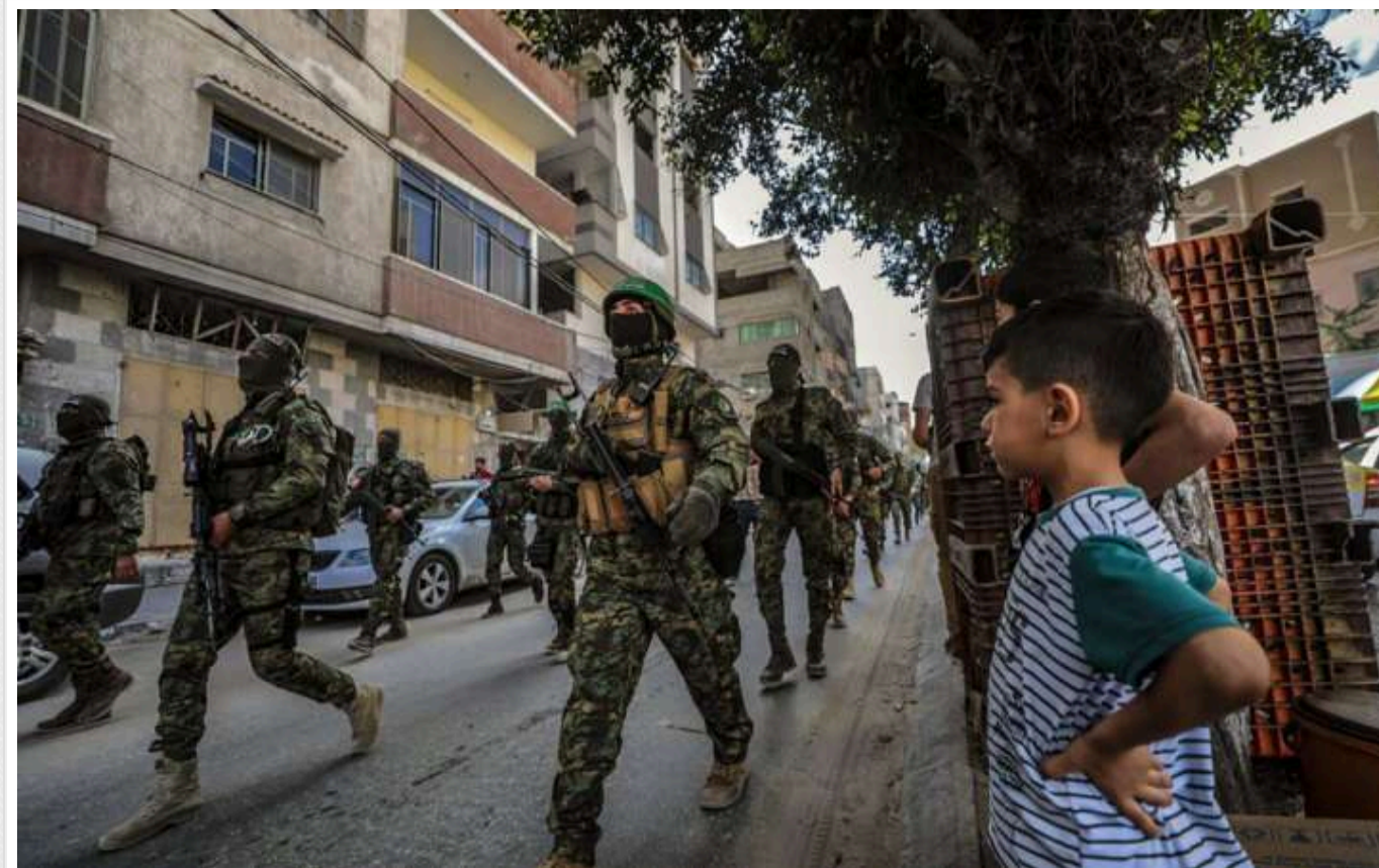
ВВС: Переговори щодо припинення вогню в Газі завершені на 90%

Перемовини щодо укладення угоди про припинення вогню в Газі, а також звільнення заручників між Ізраїлем і ХАМАС, завершені на 90%. Є важливі питання, які ще потрібно врегулювати.