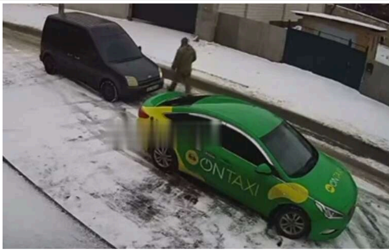
ТЦК перейшли на ловлю мобілізованих біля під'їздів

В інтернеті з'явилися відео, де чоловіка, щойно вийшовшого з таксі, перехоплює мікроавтобус біля під'їзду.