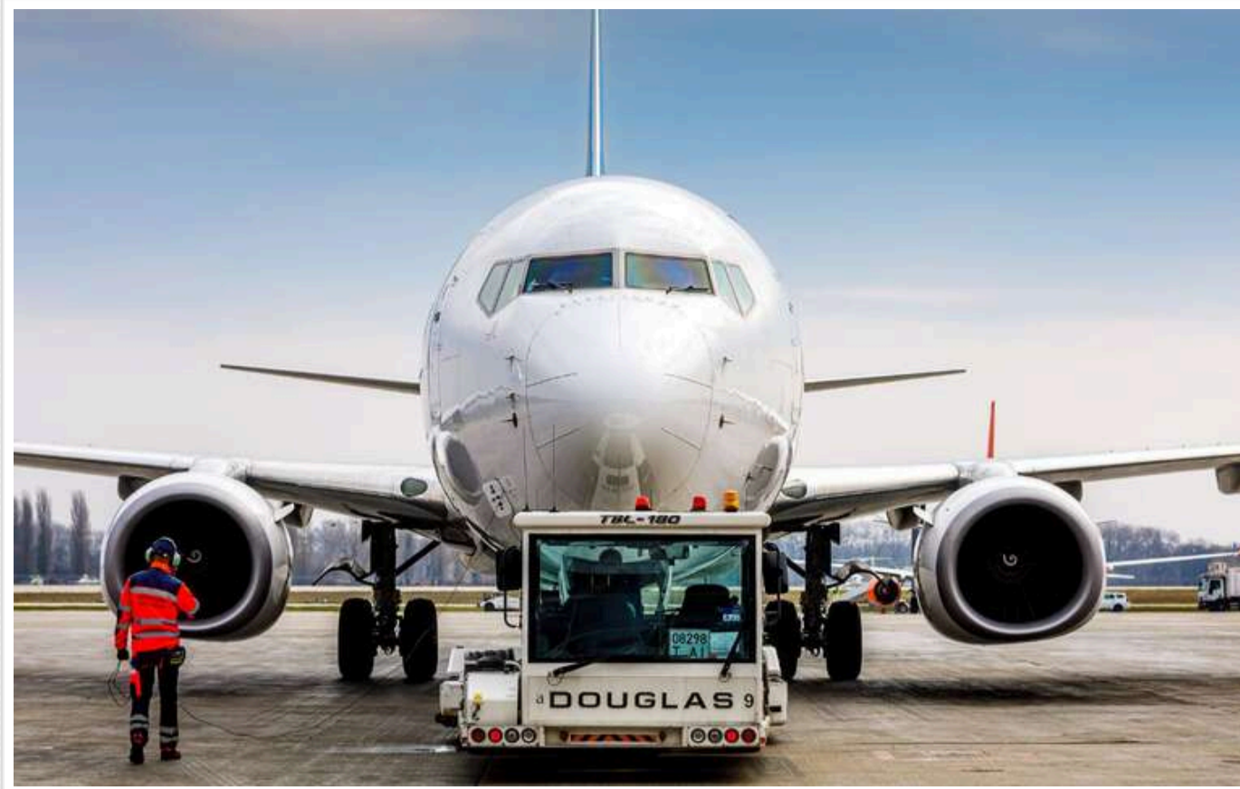
Які оклади отримують керівники аеропортів під час повномасштабної війни, - ЗМІ