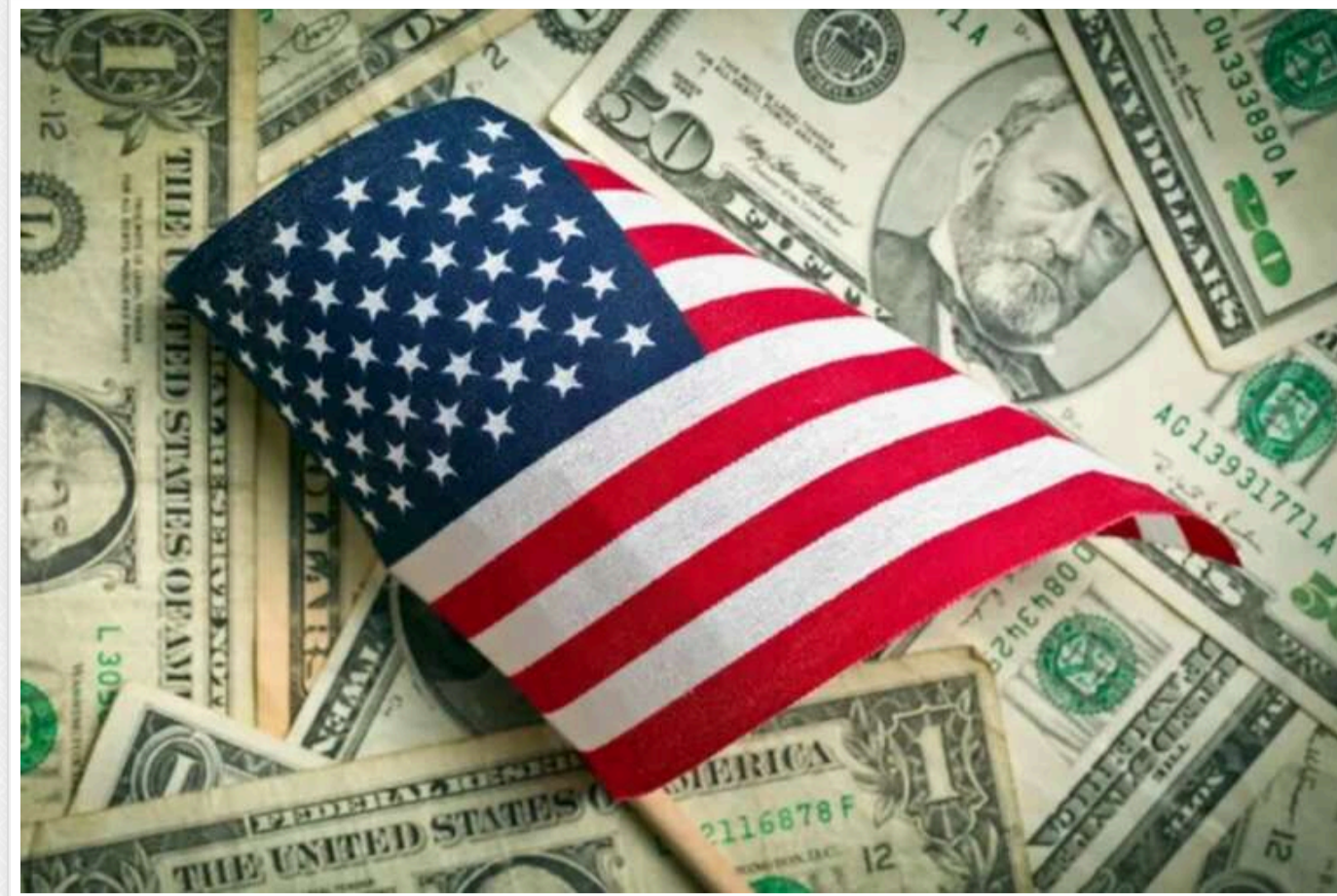
США скасують винагороду в розмірі 10 мільйонів доларів за лідера сирійських повстанців, які повалили Асада

США оголосили, що скасують винагороду в розмірі 10 млн доларів за Абу Мохаммеда аль-Джолані, лідера ісламістського угруповання "Хаят Тахрір аш-Шам", яке очолило повалення сирійського режиму Асада, як свідчення готовності Вашингтона співпрацювати з новим керівництвом країни.