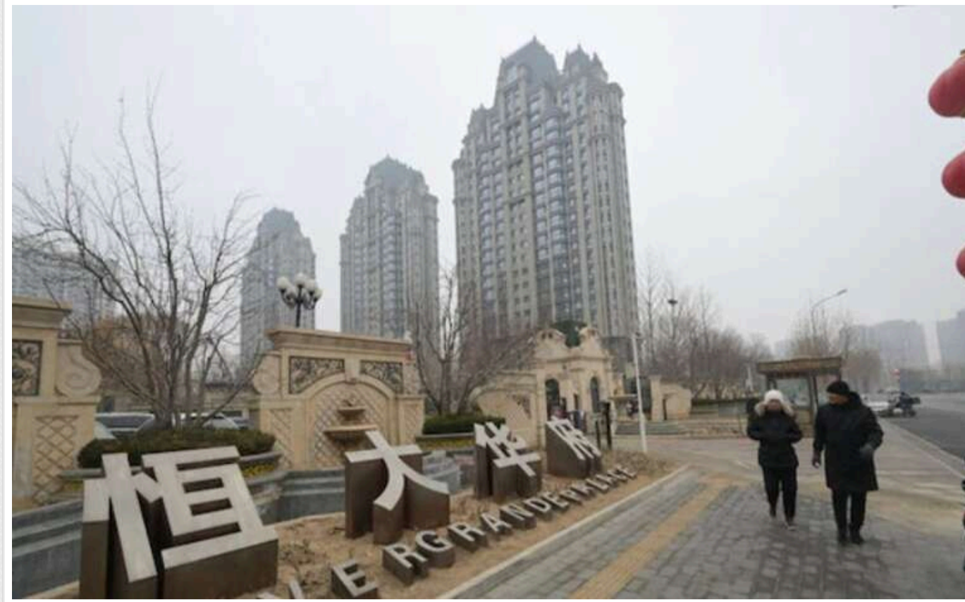
У Китаї ринок нерухомості бачить нові ознаки кризи

Проблемні девелопери все ще стикаються зі складнощами у погашенні боргів, оскільки зниження продажів житла триває. Їхні доларові облігації торгуються за проблемними рівнями, випуск боргових зобов'язань майже вичерпаний, а сектор помітно відстає на фондових ринках.