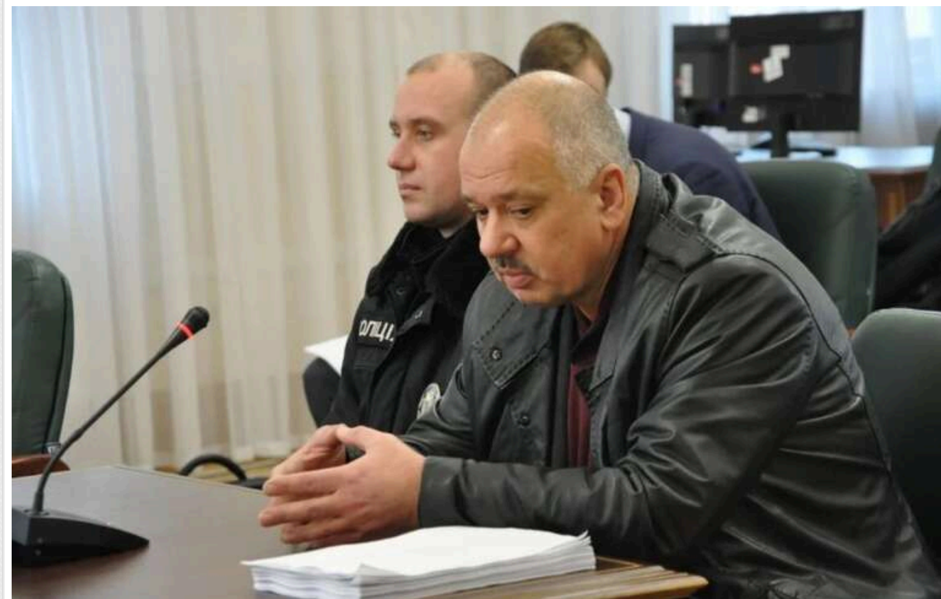
У Дружківці на Донецчині суддю та колишнього прокурора визнано винними у корупційних діях