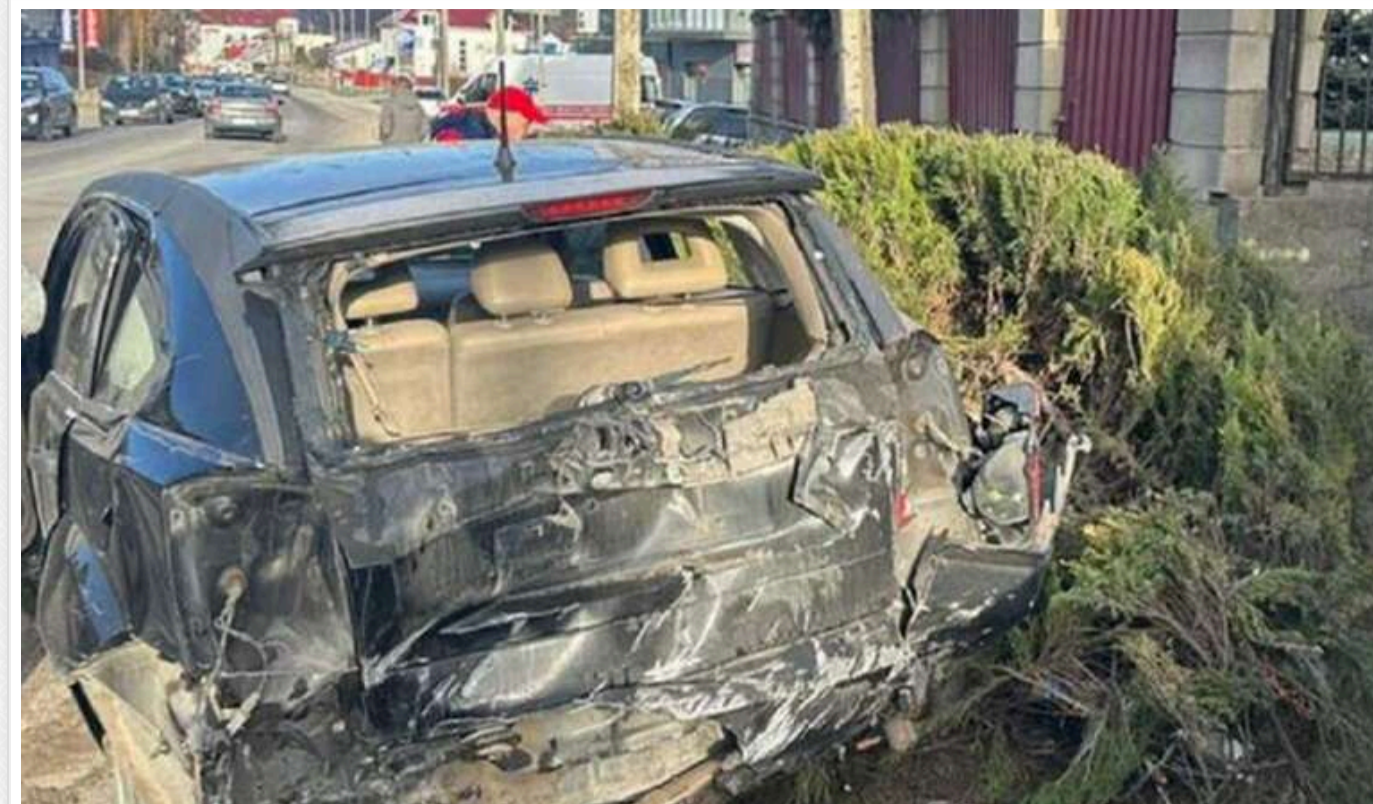
На Тернопільщині водій наїхав на двох неповнолітніх на тротуарі

У неділю, 22 грудня, на Тернопільщині водій 60 років збив двох дітей на тротуарі. ДТП сталося приблизно о 11:00 у місті Кременець.