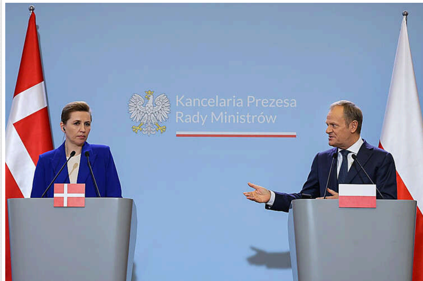
Польське та данське головування в ЄС у 2025 році має стати історичним, - Зеленський

Президент Владимир Зеленський вважає, що председательство Польши и Дании в 2025 году должны стать историческими для Украины.