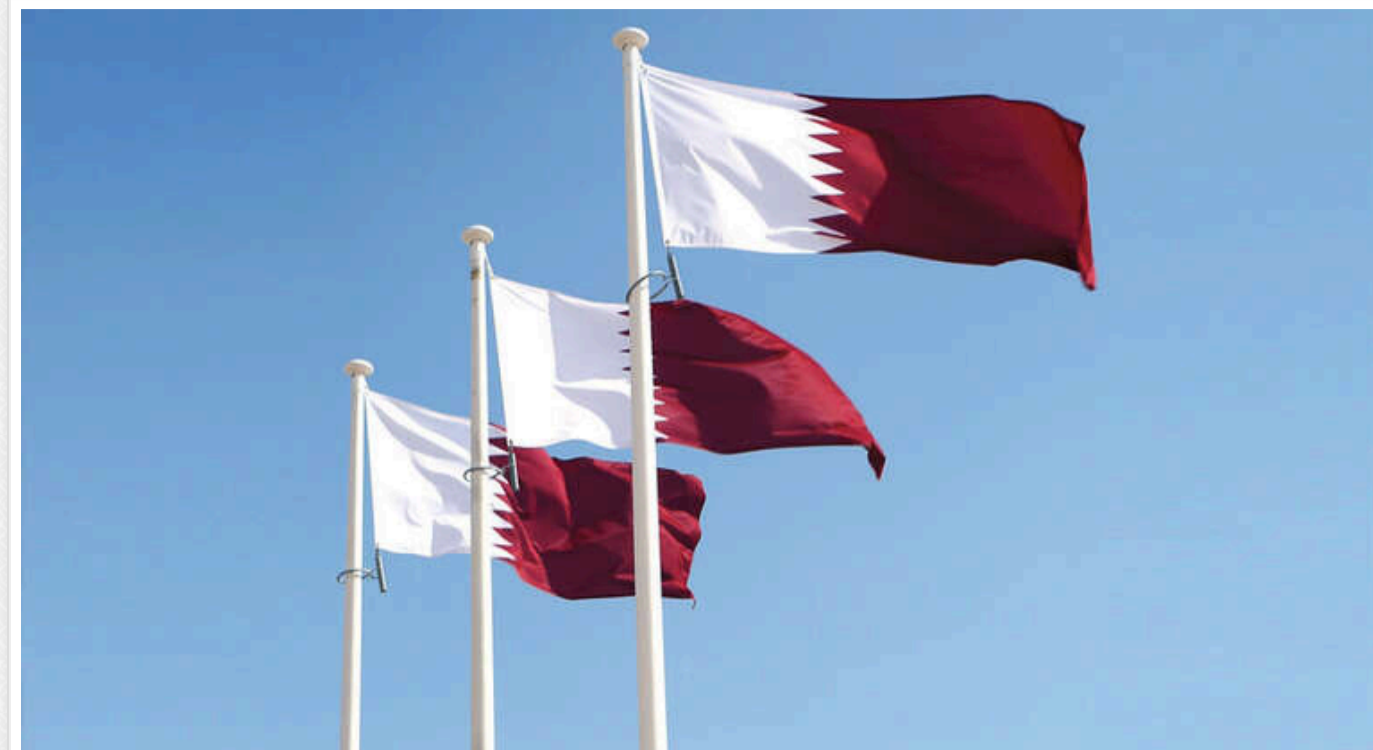
Катар пообіцяв припинити постачання газу до ЄС, якщо його оштрафують

Катар попередив про припинення експорту газу до Європейського Союзу, якщо країни ЄС запровадять штрафні санкції згідно з нещодавно прийнятим законодавством.