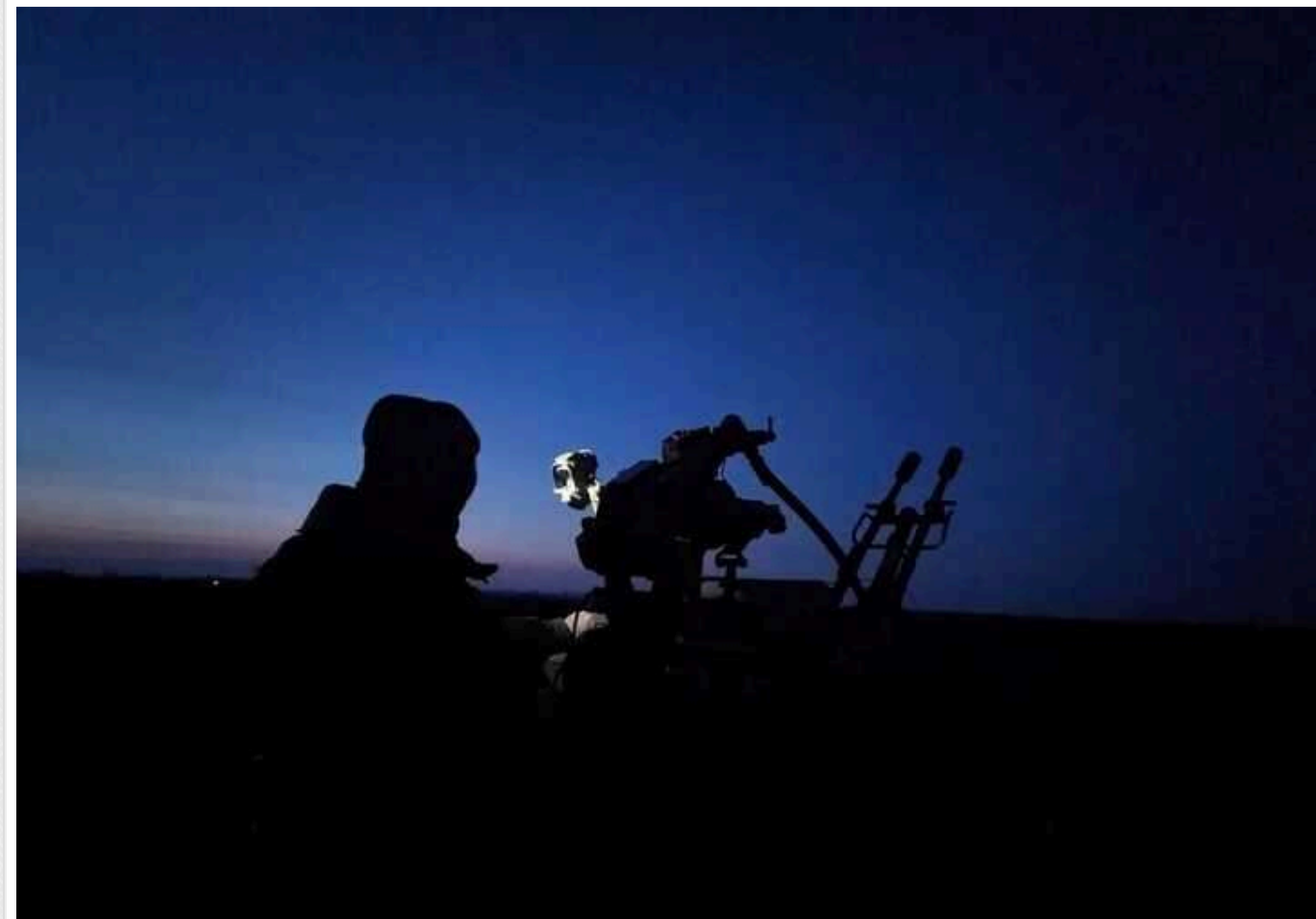
Ворог вночі випустив по Україні понад сотню дронів

У ніч на неділю, 22 грудня, російські війська здійснили атаку на Україну за допомогою 103 ударних БПЛА та безпілотників інших типів.