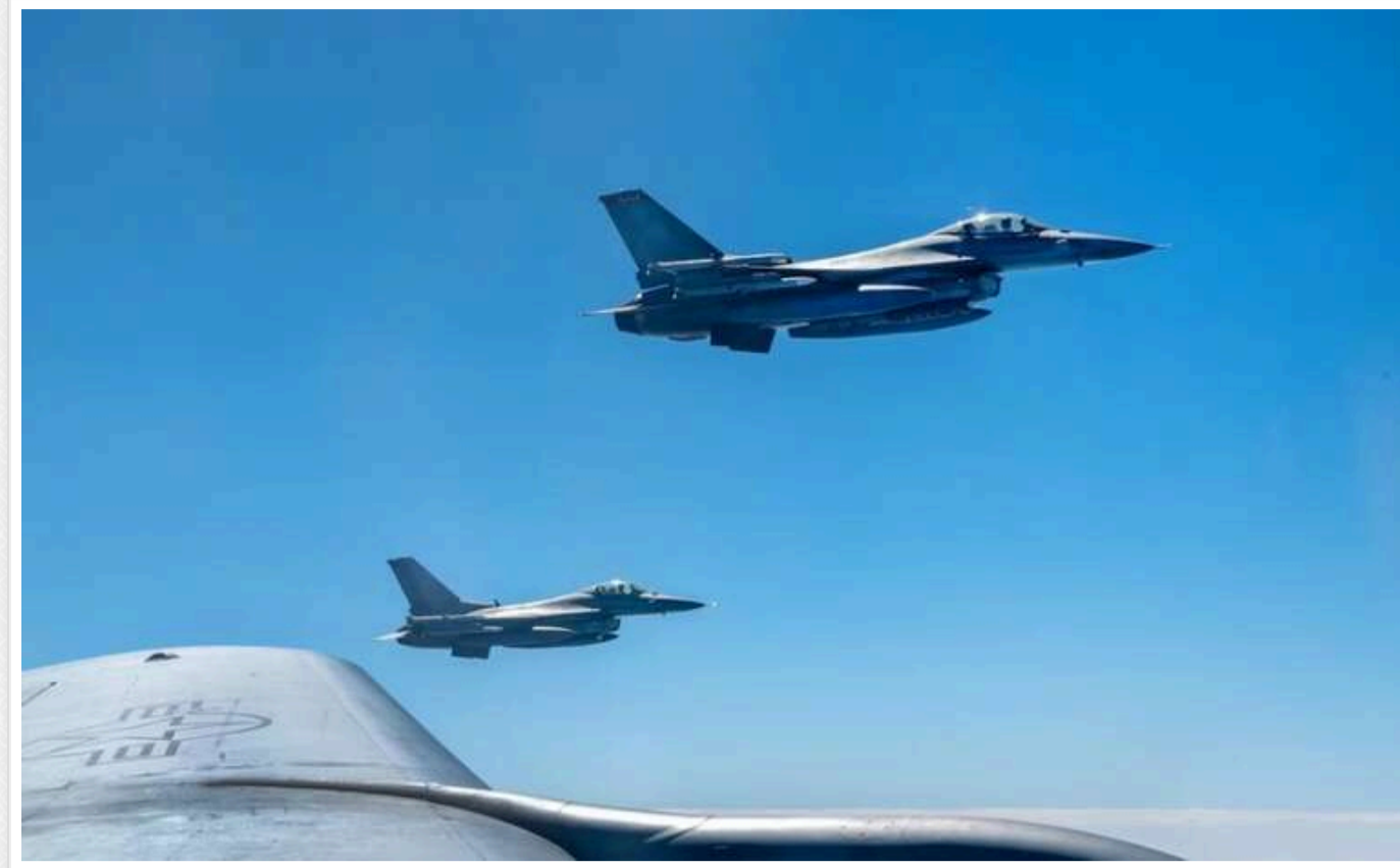
Ракетний крейсер США помилково збив американський винищувач F/A-18

Винищувач F/A-18 Super Hornet ВМС США із двома пілотами був збитий над Червоном морем. Інцидент стався внаслідок "дружнього вогню".