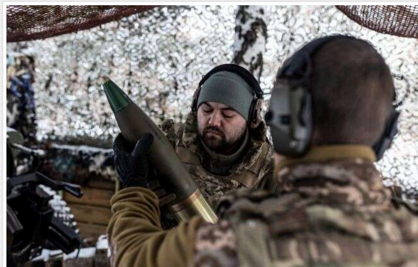
ISW: ЗСУ повернули втрачені території під Покровськом, у окупантів проблеми з бронетехнікою

Українські Сили оборони нещодавно просунулися на південний захід від Покровська та відновили контроль над деякими позиціями. Російські війська продовжують наступальні дії в цьому районі, однак стикаються зі ще більшою нестачею бронетехніки.