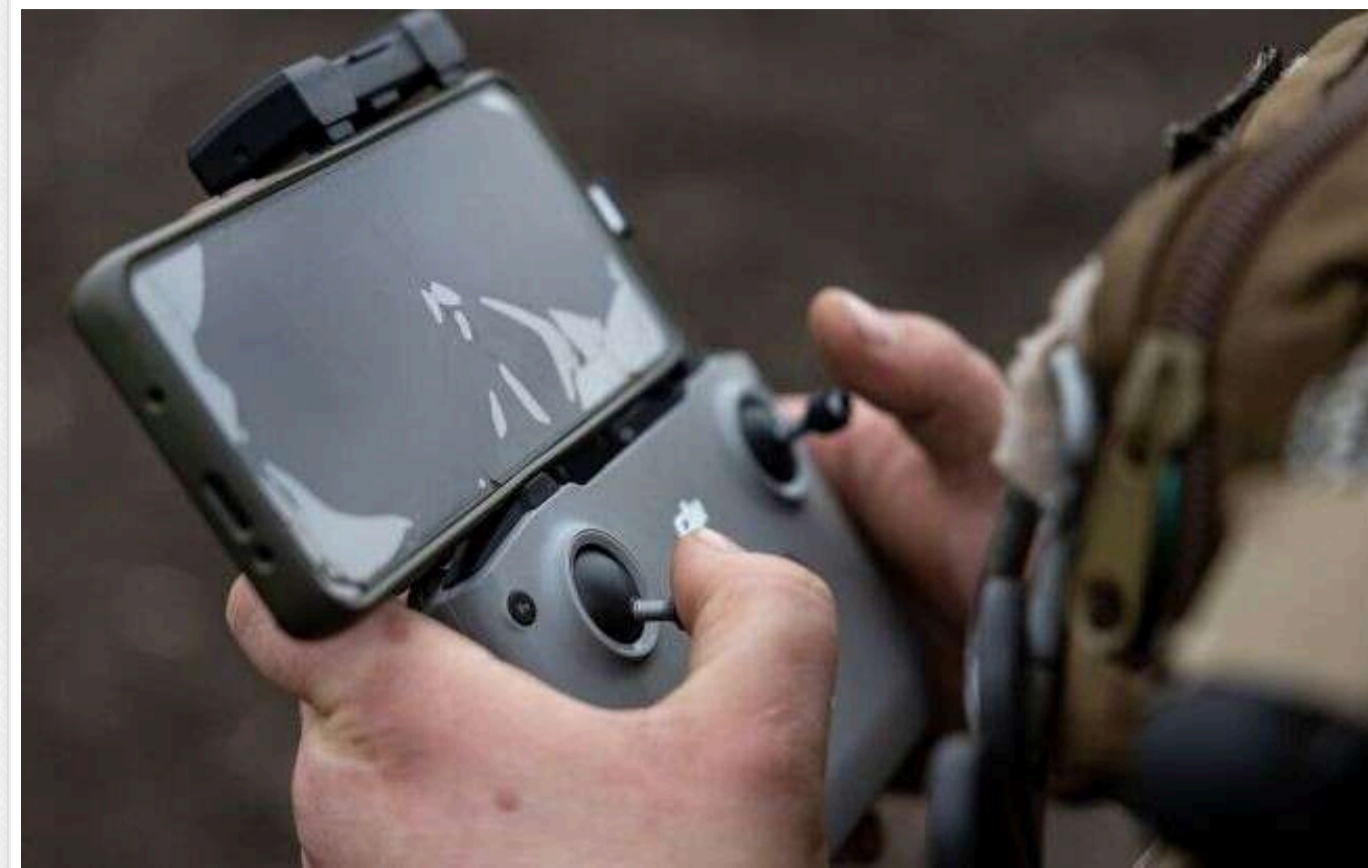
ISW: Росія пішла на хитрощі з залученням солдатів КНДР у боях на Курщині

Російське військове командування продовжує намагатися приховати розгортання північнокорейських сил у Курській області РФ. Ймовірно, це відбувається шляхом неправдивої характеристики громадян КНДР як представників різних етнічних груп.