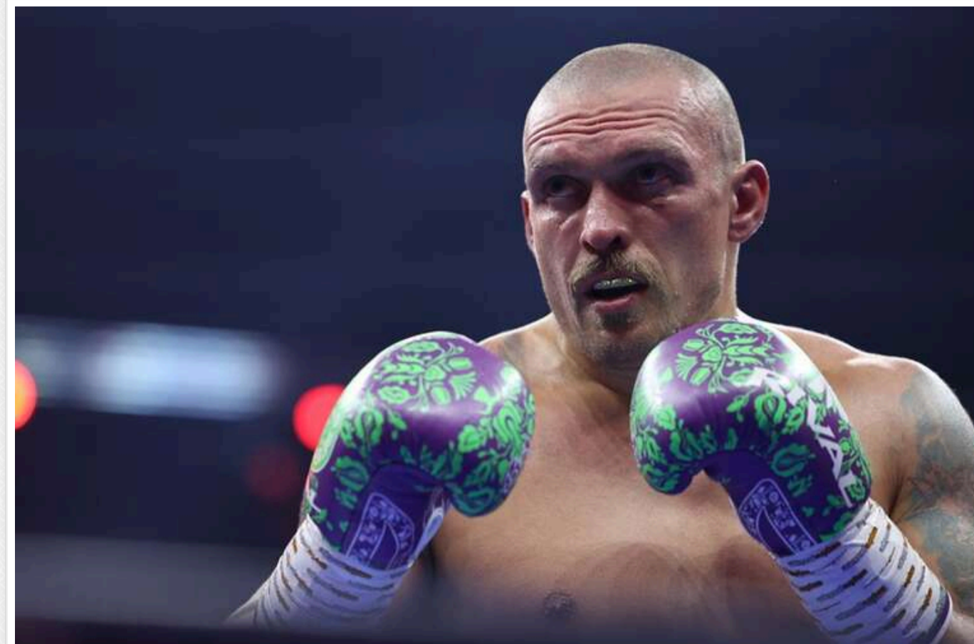
Усик присвятив другу перемогу над Ф'юрі своїй матері: на ринг виніс шаблю гетьмана Мазепи

Олександр Усик після другої перемоги над Тайсоном Ф'юрі присвятив цей успіх своїй матері.