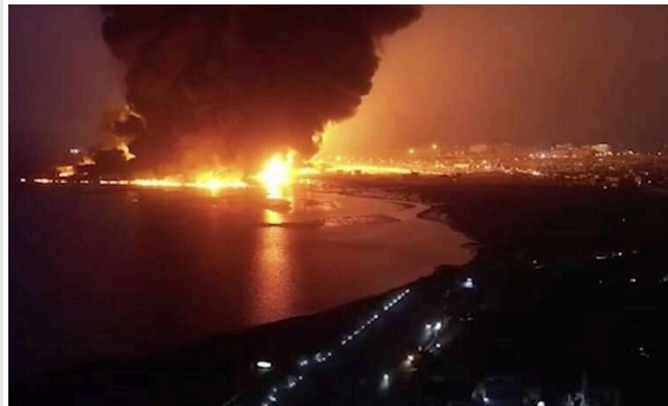
Після атаки хуситів на Ізраїль у столиці Ємену пролунали вибухи

У суботу, 21 грудня, хусити здійснили удар по Тель-Авіву в Ізраїлі. Через кілька годин вибух стався у столиці Ємену, місті Сана.