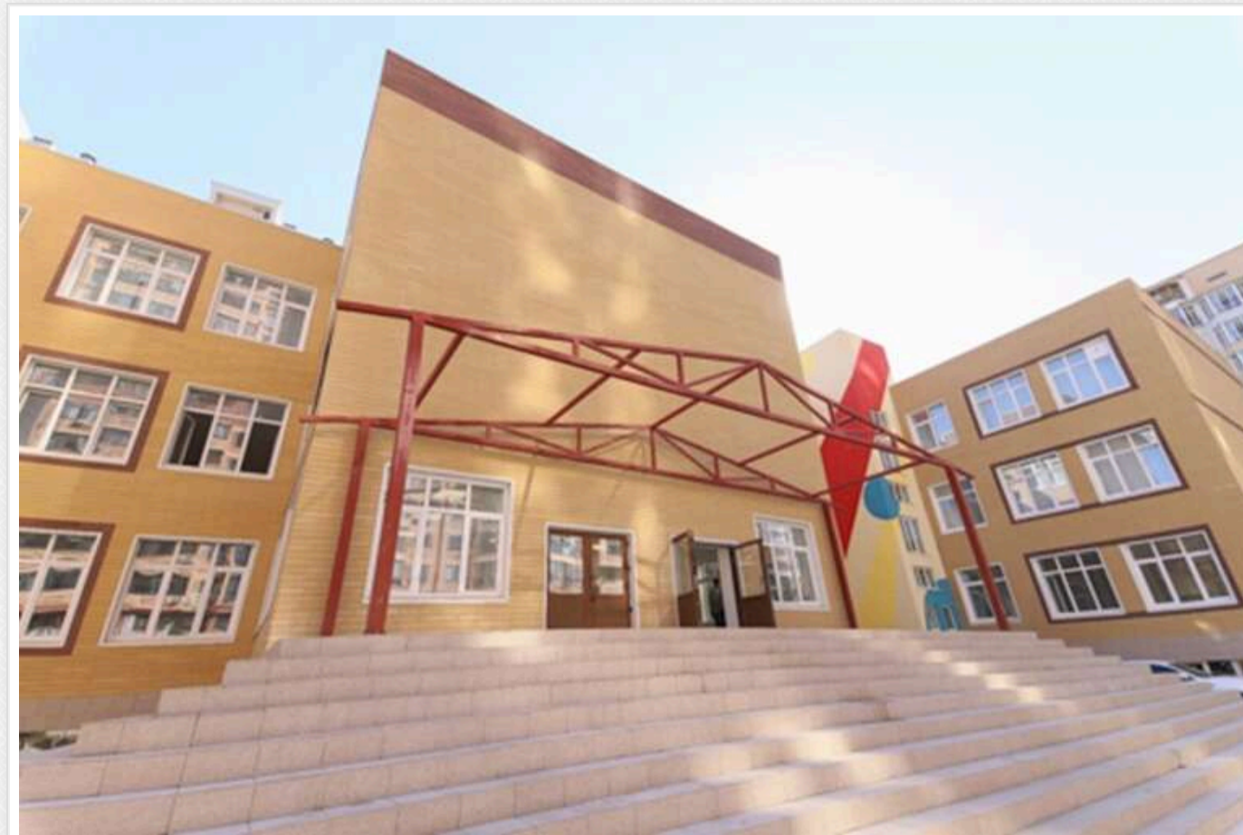
В Одесі вчителька історії проводила уроки російською та поширювала антиукраїнські нарративи

В Одесі спалахнув скандал через дії вчительки української історії, яка проводила заняття російською мовою та поширювала антиукраїнські лозунги. Вчителька була звільнена після початку службового розслідування.