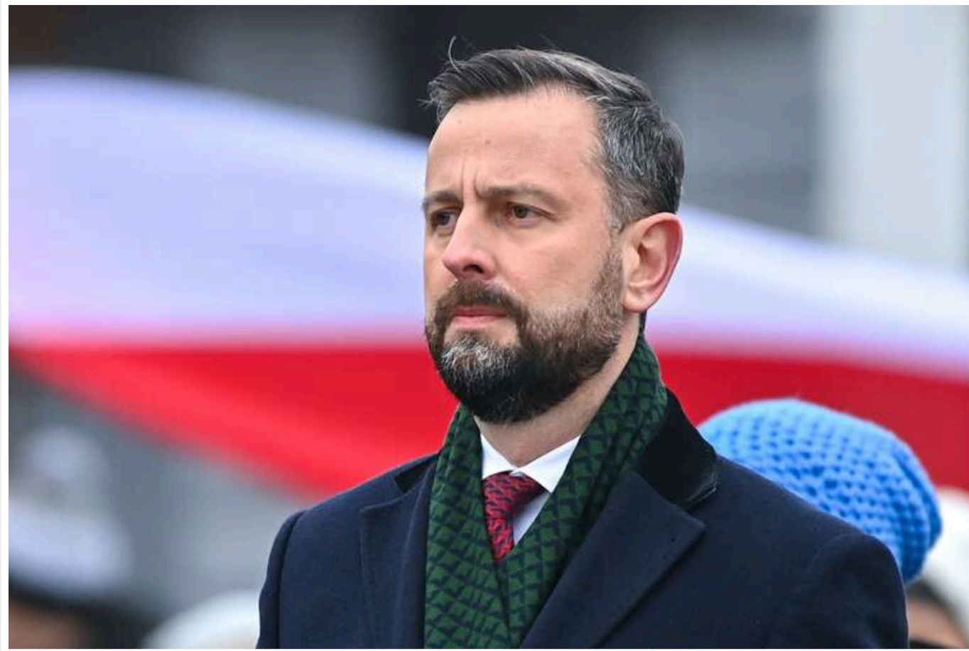
У Польщі готові збивати російські ракети: назвали умову

Польща готова збивати над своєю територією російські ракети. Однак це буде можливим за певних умов.