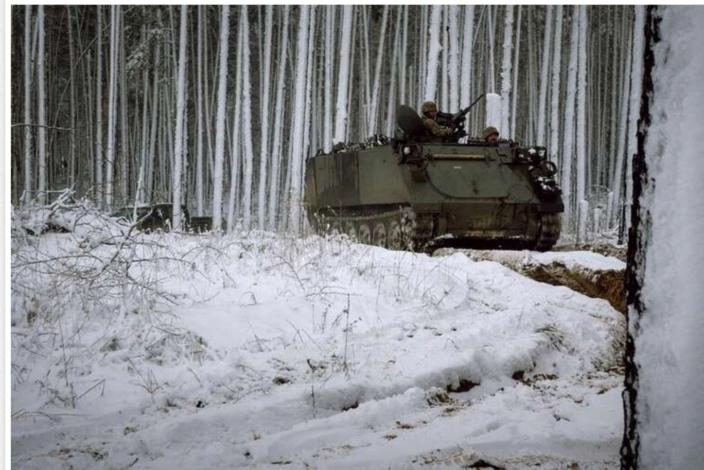
Ситуація на фронті: ворог здійснив 32 спроби штурму в Курській області

Станом на 16:00, 21 грудня, на фронті з початку доби відбулося 110 бойових зіткнень. Лише в Курській області ворог здійснив 32 спроби штурму, бої ще тривають.