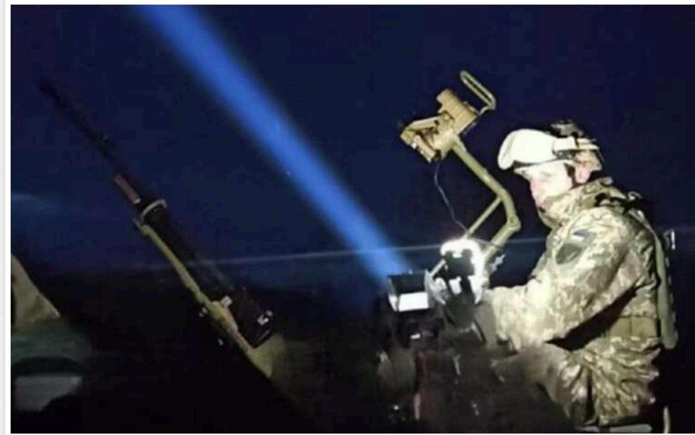
The Guardian: Згідно з наказом Генштабу, значна кількість особового складу з підрозділів ППО буде переведена в піхоту

The Guardian, посилаючись на військових у протиповітряній обороні, зазначає, що дефіцит на фронті в Україні став настільки гострим, що Генеральний штаб наказав "і без того виснаженим підрозділам ППО" вивільнити більше людей, щоб відправити їх на фронт у якості піхоти.