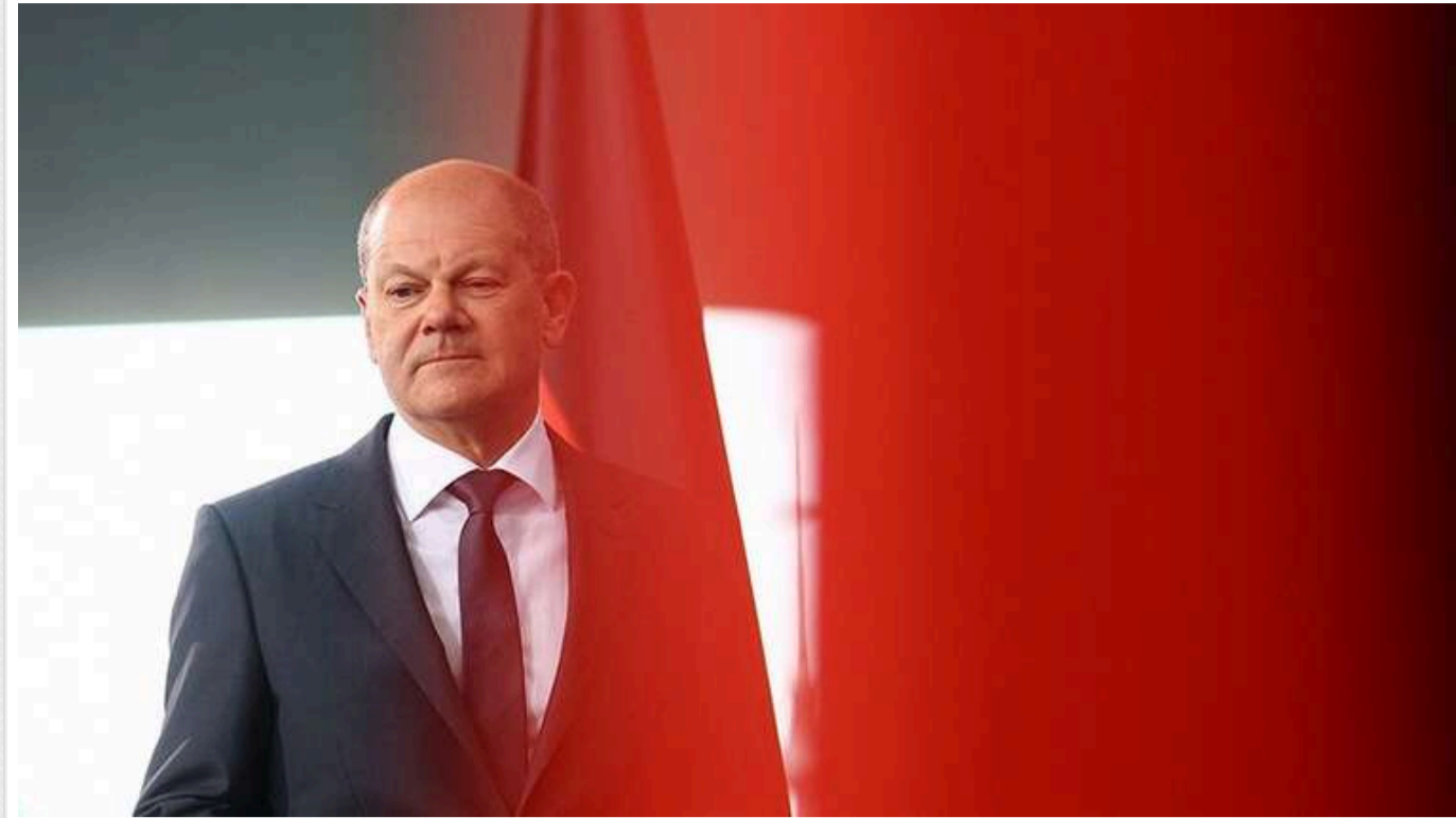
В СДПН занепокоєні втручанням Маска та Путіна у виборчу кампанію

Соціал-демократична партія Німеччини вважає, що рекомендація американського мільярдера Ілона Маска голосувати за ультраправу "Альтернативу для Німеччини" є "атакою на німецьку демократію".