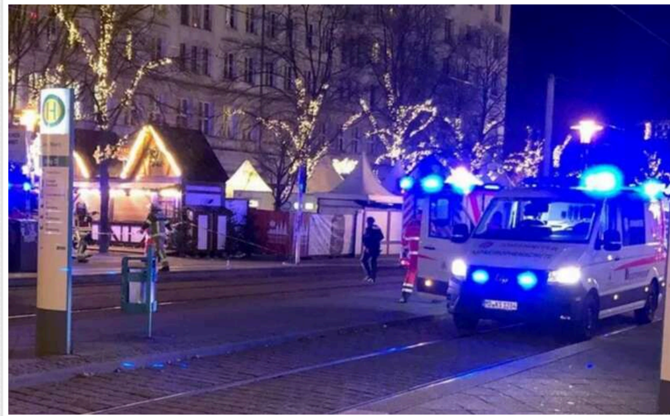
Канцлер і міністр внутрішніх справ Німеччини їдуть в Магдебург, де на ярмарку стався наїзд на людей

Канцлер Німеччини Олаф Шольц та міністерка внутрішніх справ Ненсі Фезер у суботу відвідають Магдебург, де напередодні автомобіль наїхав на людей на різдвяному ярмарку.