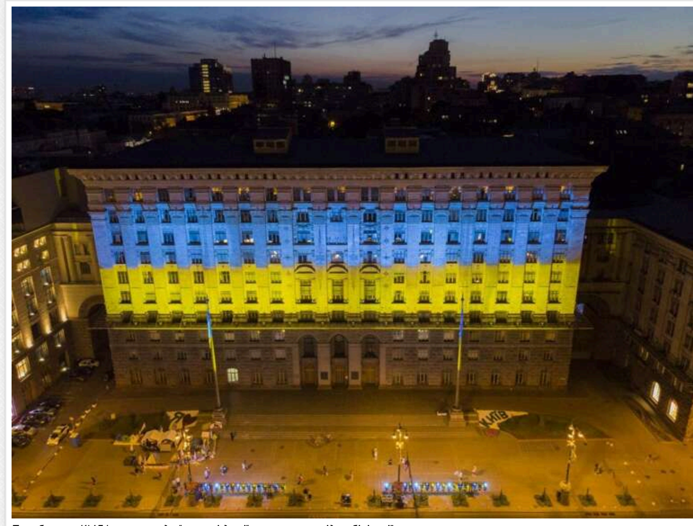
Тихе болото КМДА: казнокради, "мертві душі" та ухилення від мобілізації

Київські посадовці організують схеми для уникнення мобілізації своїми друзями-земляками, що також приносить чималий прибуток як приємний бонус.