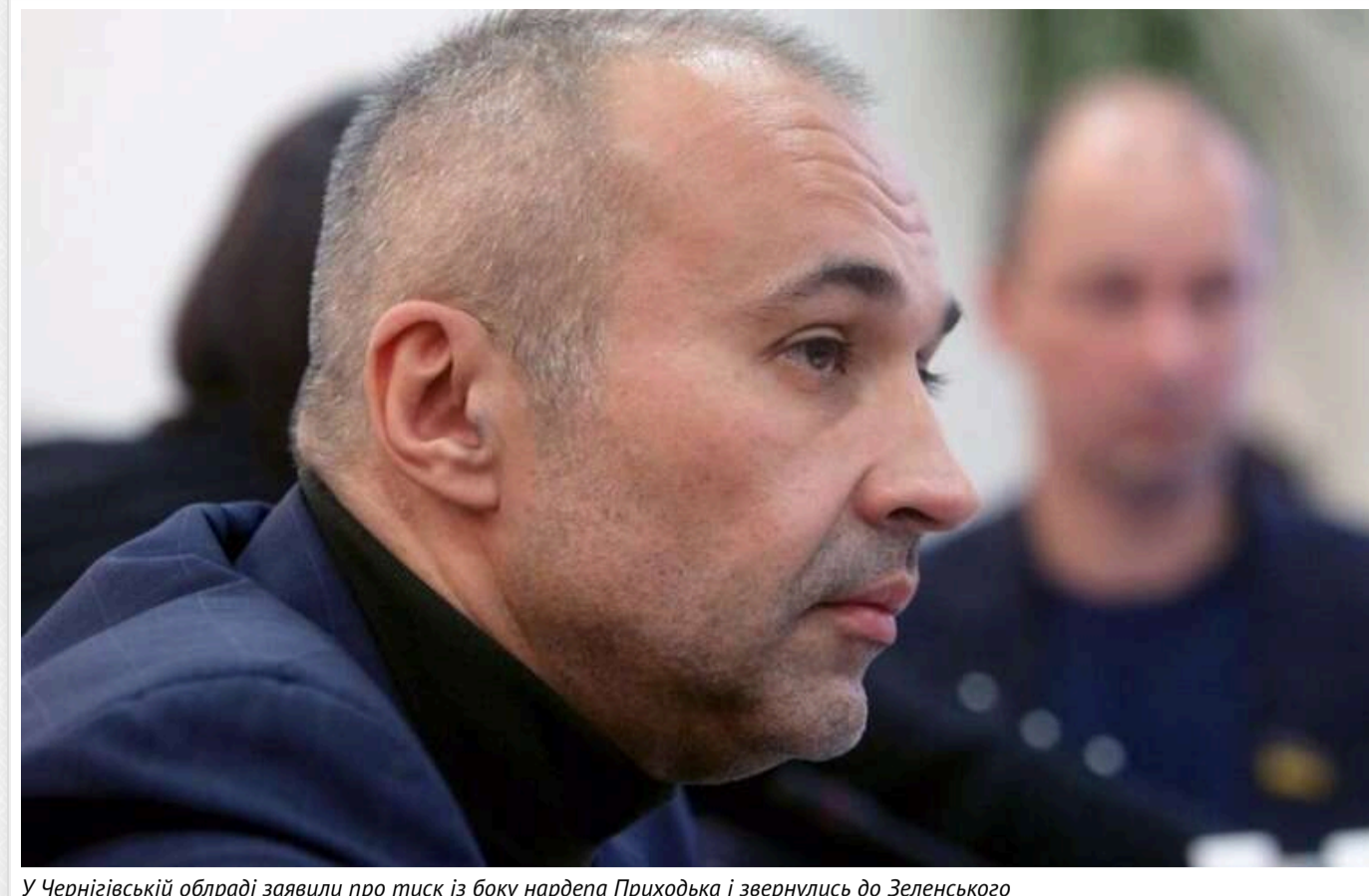
У Чернігівській облраді заявили про тиск із боку нардепа Приходька і звернулись до Зеленського

Депутати Чернігівської обласної ради від імені громади області звернулись до президента України Володимира Зеленського з вимогою зупинити спроби захоплення підприємств, до яких, на думку народних обранців, причетний народний депутат Борис Приходько.