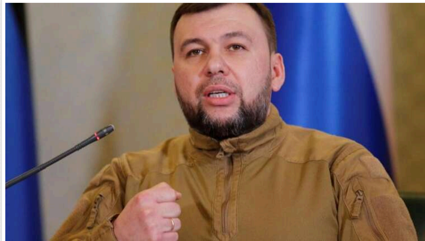
Ватажок "ДНР" заявив, що буде активніше переселяти мешканців «республіки» в чужі квартири

Ватажок "ДНР" Денис Пушилін пообіцяв активізувати процес заселення нових мешканців у квартири, конфісковані у їхніх законних власників.